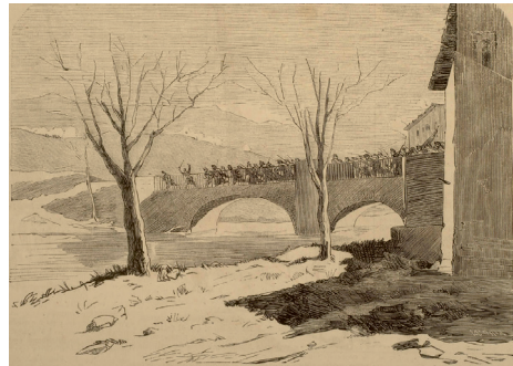
Paso del puente de Somorrostro por los cazadores de Ciudad-Rodrigo 2 .

que cruzan todos los días para ir a clase es el mismo que utilizaban las tropas liberales en 1874? ¿Podríamos facilitar una herramienta para que los profesores expliquen el convulso siglo XIX de una manera más amena? ¿Nos dejaría el CDD Trueba reutilizar sus contenidos? ¿Se dejarían asesorar los autores en cuanto a las licencias y los formatos? ¿Se animaría el Ayuntamiento a poner un panel informativo con un código QR que permita el acceso a toda la información que estamos recopilando a quien se acerque por nuestro municipio?