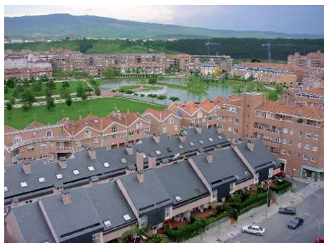
Vista de Barañáin.

Barañáin es un municipio situado en la comarca de Pamplona, en el centro geográfico de la Comunidad Foral de Navarra (España). Tiene aproximadamente 23.000 habitantes y su proximidad a la capital es tal que un paseante puede salir de Pamplona y entrar en Barañáin sin darse cuenta.