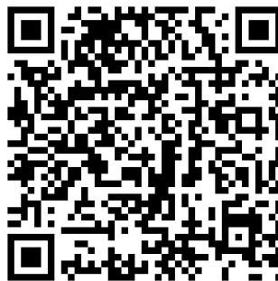
Presentación de la capa de realidad aumentada Las bata- llas de Somorrostro 1874 .