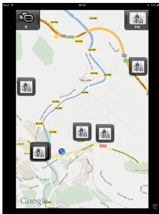
Información geoposicionada. El punto azul es la situación del usuario.

Herramientas como Augmentation reducen las dificultades de participación en la realidad aumentada (crear contenido es tan sencillo como abrir un blog) y permite a los usuarios centrarse en crear contenido obviando los complejos aspectos técnicos 10 .