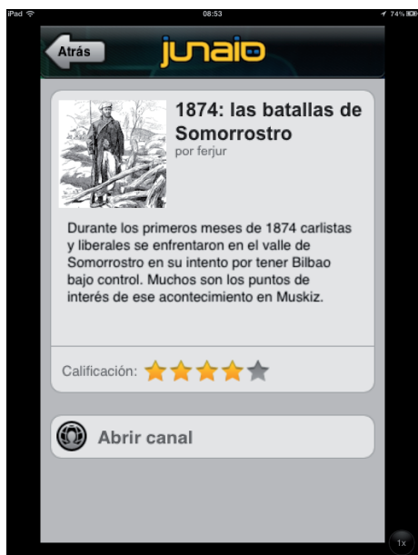
Acceso a la capa desde el iPad en Junaio.

Como hemos apuntado la colaboración con el CDD Trueba era el estímulo que necesitábamos para generar un nuevo contenido local acorde a la evolución de las necesidades de nuestra sociedad digital. Gracias a esa colaboración hemos