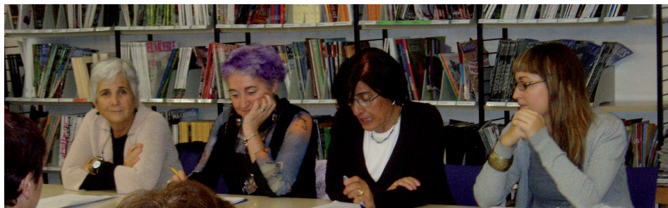
Mesa redonda. 25 años de políticas de igualdad.

casos, alguien de la biblioteca o del área de cultura (en algunos casos también del Auditorio) estuvo presente, como moderador de la conversación. Y esta circunstancia también merece destacarse, porque nos parece que el hecho de que fuera un proyecto de colaboración con distintos servicios finalmente lo enriqueció.