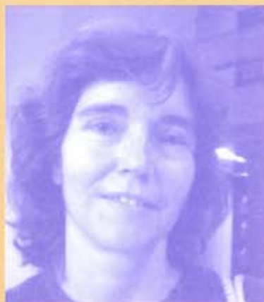
Es miembro de esta sección:

Para más información se puede consultar la página web de la Sección en la siguiente dirección: http://www.ifla.org/VII/s16/index.htm