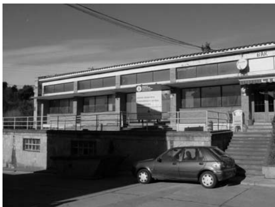
Edificio del Biblioacces de Vinyoles (Julio del 2005)

El Biblioacceso-Vinyoles fue inaugurado el ocho de julio del 2005 y está gestionado por el Ayuntamiento de les Masies de Voltregà, en colaboración con la Diputació de Barcelona. Actúa de