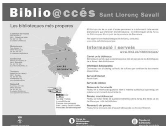
Modelo de panel. Biblioaccés de Sant Llorenç Savall.

La Diputació de Barcelona aporta: colección inicial (obras de referencia, títulos de revista); panel de difusión con información de los recursos bibliotecarios más cercanos; dinamización a través del bibliobús; servicios a través del bibliobús.