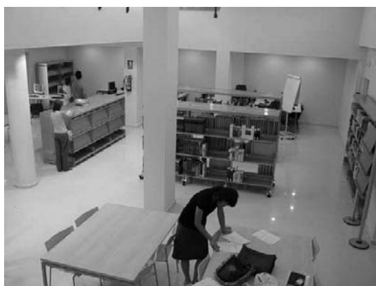
Biblioaccés de Hostalets de Pierola. "Preparando la inauguración"

El tercer biblioaccés, de reciente inauguración, se encuentra en el municipio de Hostalets de Pierola < http://www.elhostaletsdepierola.cat/ >. Hostalets de Pierola tiene 1.889 habitantes (censo de enero 2005). Los ciudadanos del municipio reciben el servicio bibliotecario a través del bibliobús Montserrat todos los jueves de 11'30 a 14 h. < http://www.diba.cat/agda/biblioteques/BiblioView.asp?Bib=2388 >.