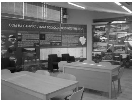
Exposició "Rius a la Comarca d'Osona". Biblioacces de Vinyoles (Febrero del 2006).