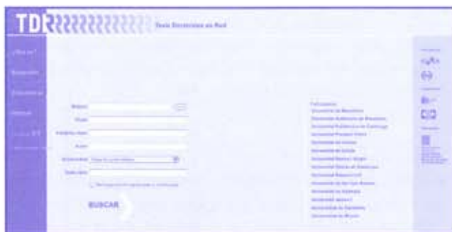
Imagen servidor TDR

La Universitat Autònoma de Barcelona (UAB) incorporó el 1 de diciembre pasado la tesis número 3.000 en Tesis Doctorales en Red (TDR). Este servicio, coordinado por el Centre de Super-computació de Catalunya (CESCA) y el Consorci de Biblioteques Universitàries de Catalunya (CBUC) y patrocinado por el Departament d'Universitats, Recerca i Societat de la Informació (DURSI) de la Generalitat de Catalunya, promueve la incorporación de las tesis doctorales que se leen en las universidades para que estén disponibles a través de Internet con acceso abierto