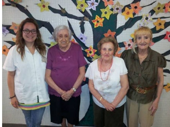
Detalle de algunas de las participantes del Centro de Día con su educadora social.